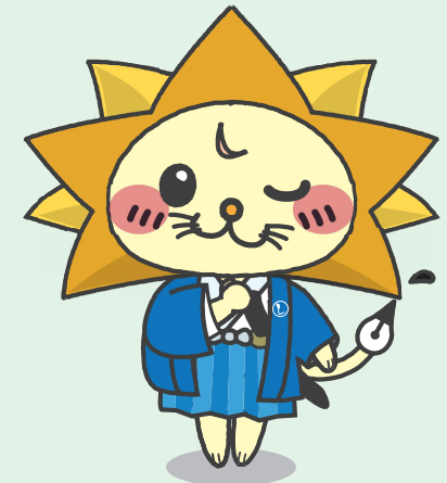
日司連公式キャラクター「しほ〜しし」